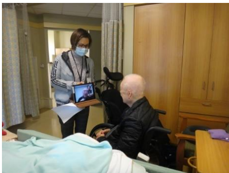
一位長者在 iPad 上與家人視像對話。

讓我們一起為頤康加油，為長者加油，為疫情中的關愛加油！如您欲捐贈物資或善款，請聯絡頤康基金會，並發送郵件至： foundation@yeehong.com 。