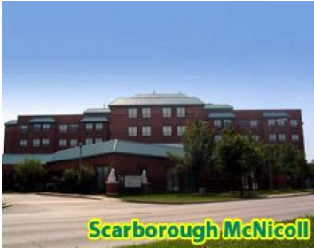
士嘉堡 麥瀝高中心